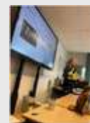
Vorige week stond in het teken van de Week van Respect, de nationale bewustwordingscampagn... Vorige week stond in het teken van de Week van... nl.livakidn.com