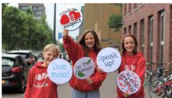
Provincie Drenthe eerste RespectProvincie van Nederland

Provincies vormen belangrijke samenwerkingspartner in de Week van Respect. Zij verbinden gemeenten, onderwijs en maatschappelijke organisaties en hebben zicht op regionale vraagstukken. Om respect duurzaam te verankeren in beleid en praktijk werkt REF samen met provinciale partners. Dit jaar zijn twee provincies aangesloten: Drenthe en Utrecht. Met deze provincies heeft REF activiteiten georganiseerd die aansluiten op provinciale behoeften en dromen.