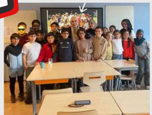
In mijn klas op een openbare school in Rotterdam Zuid zaten kinderen met verschillende achtergronden. Ongeveer de helft had een migratie... In mijn klas op een openbare school in Rotterdam Zuid zaten kinderen met verschillende achtergronden. Ongeveer de helft had een migratie achtergrond. We leerden samen en besteedden weinig aandacht aan verschillen. Dat dagelijkse... nl.livakidn.com

"De kinderen maakten kennis met de wijkboa, ontdekten wat hun werk inhoudt en stelden de leukste en meest verrassende vragen. Op verschillende manieren doken we in het thema respect: praten over taalgebruik, 'Over de Streep' met stellingen die aan het denken zetten en hoe je goed omgaat met je buurt en de mensen om je heen." Leerkracht po Gemeente Amersfoort