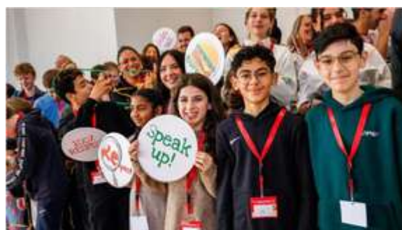
Provincie Utrecht doet mee aan de Week van Respect