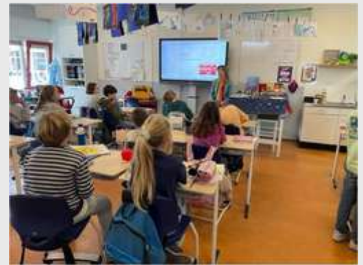
RESPECT VOOR ELKAAR, ALTIJD EN OVERAL. Afgelopen week stond bij ons als Gemeente Zeist in het teken van de landelijke Week van Respect VOOR ELKAAR, ALTIJD EN OVERAL. Afgelopen week stond bij ons als Gemeente Zeist in het teken van de landelijke Week van Respect. Samen met de Respect Foundation scholen Stichting MeanderOmnium en Kunst-Huis Idea...